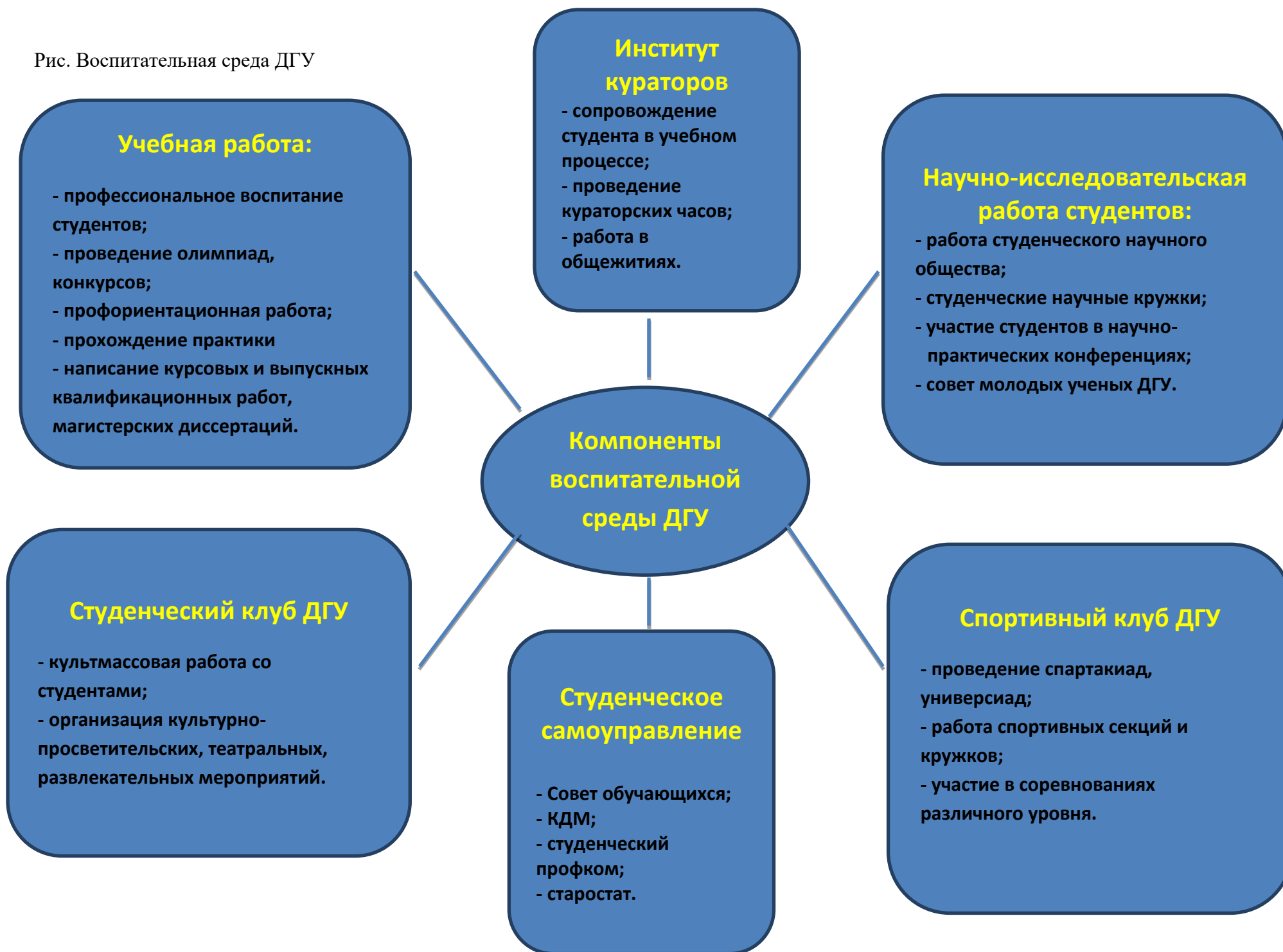
Рис. Воспитательная среда ДГУ