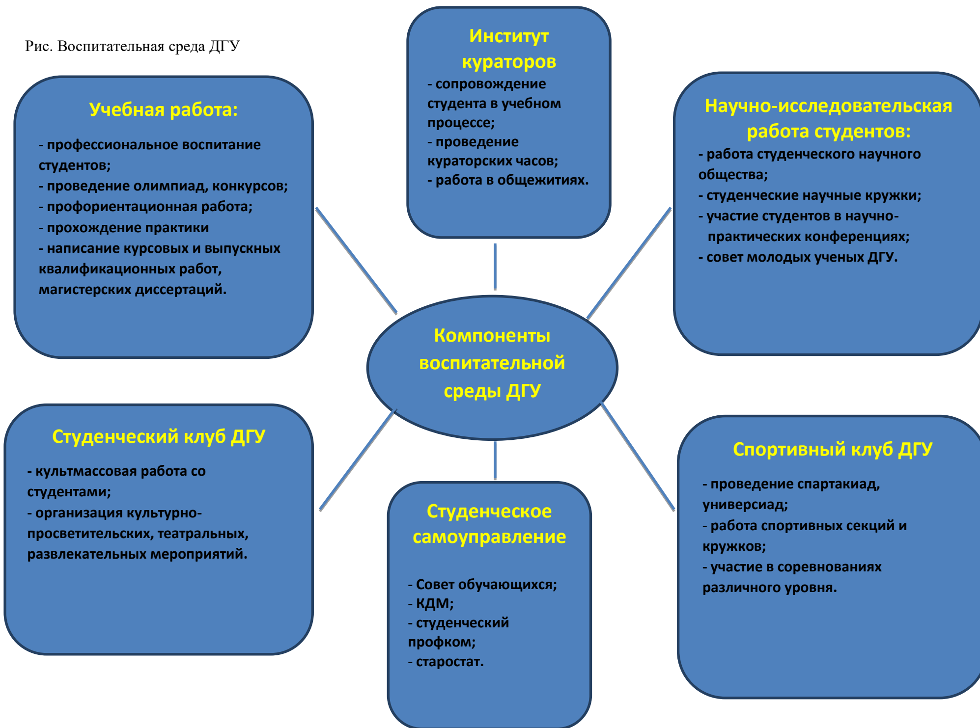
Рис. Воспитательная среда ДГУ