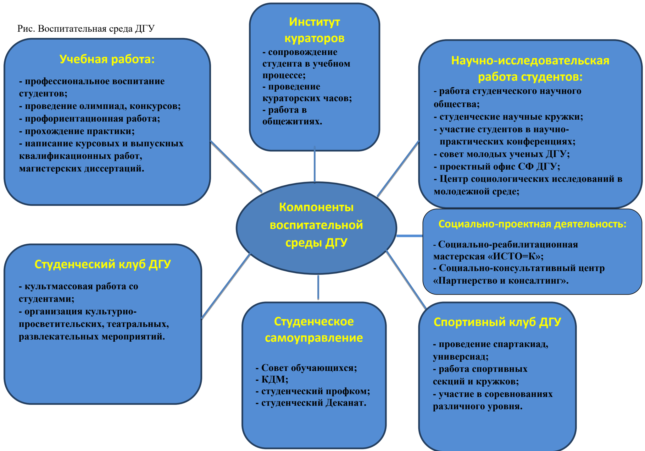
Рис. Воспитательная среда ДГУ