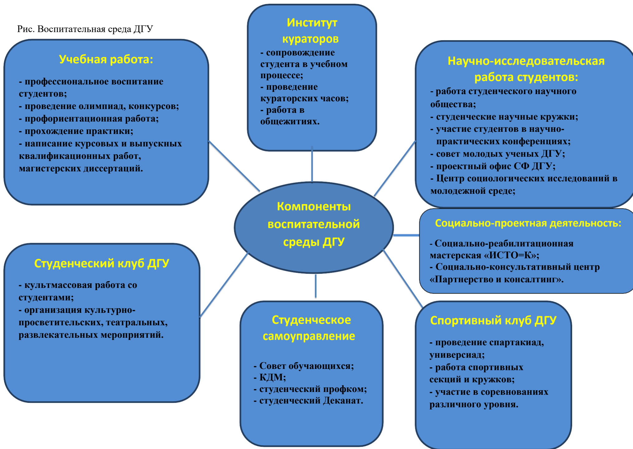
Рис. Воспитательная среда ДГУ