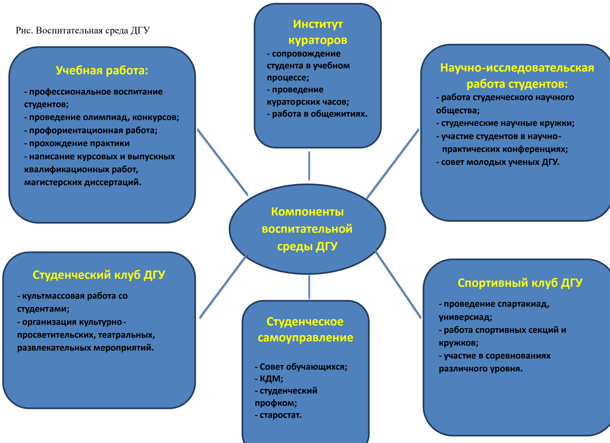
Рис. Воспитательная среда ДГУ