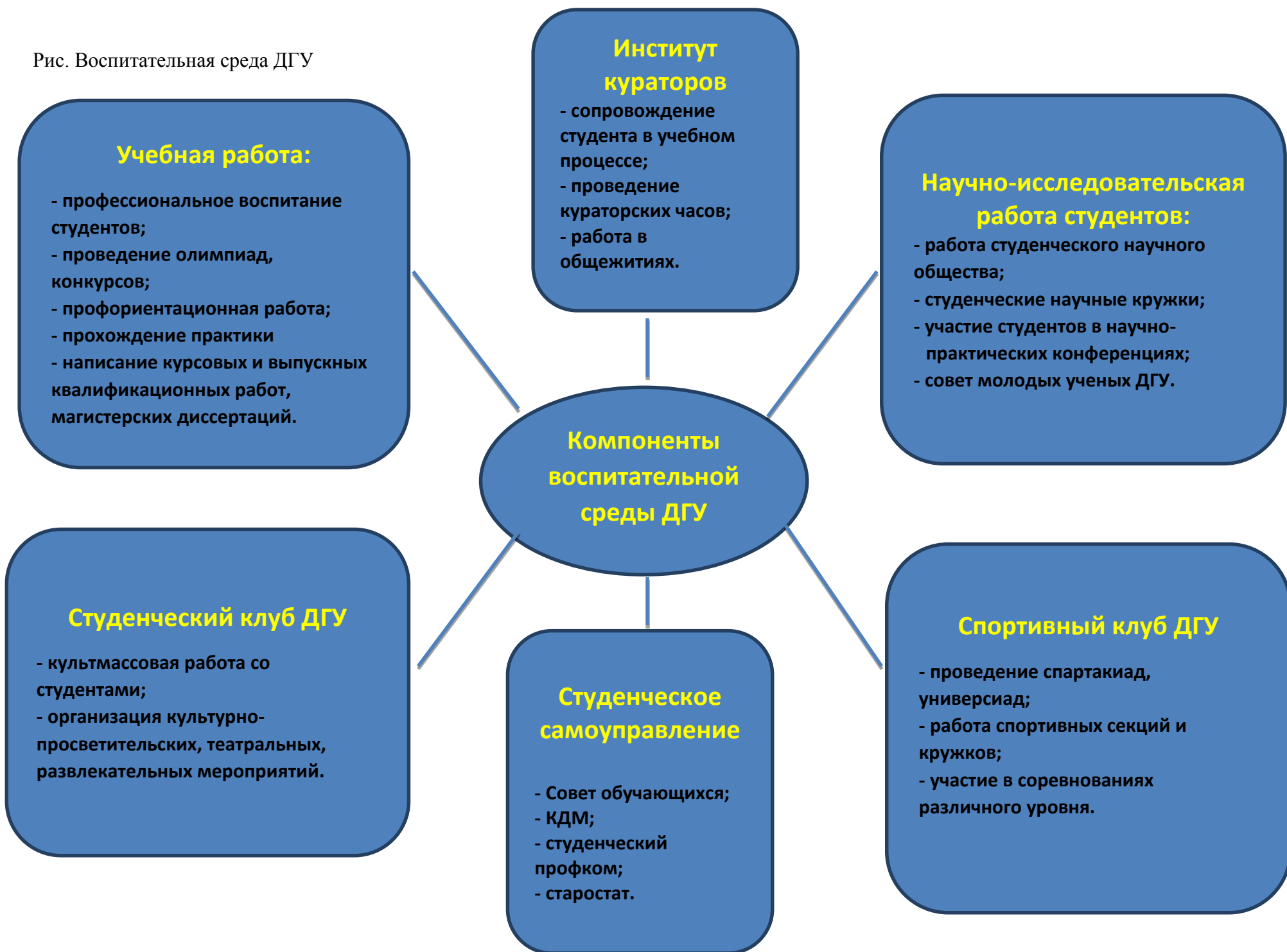
Рис. Воспитательная среда ДГУ