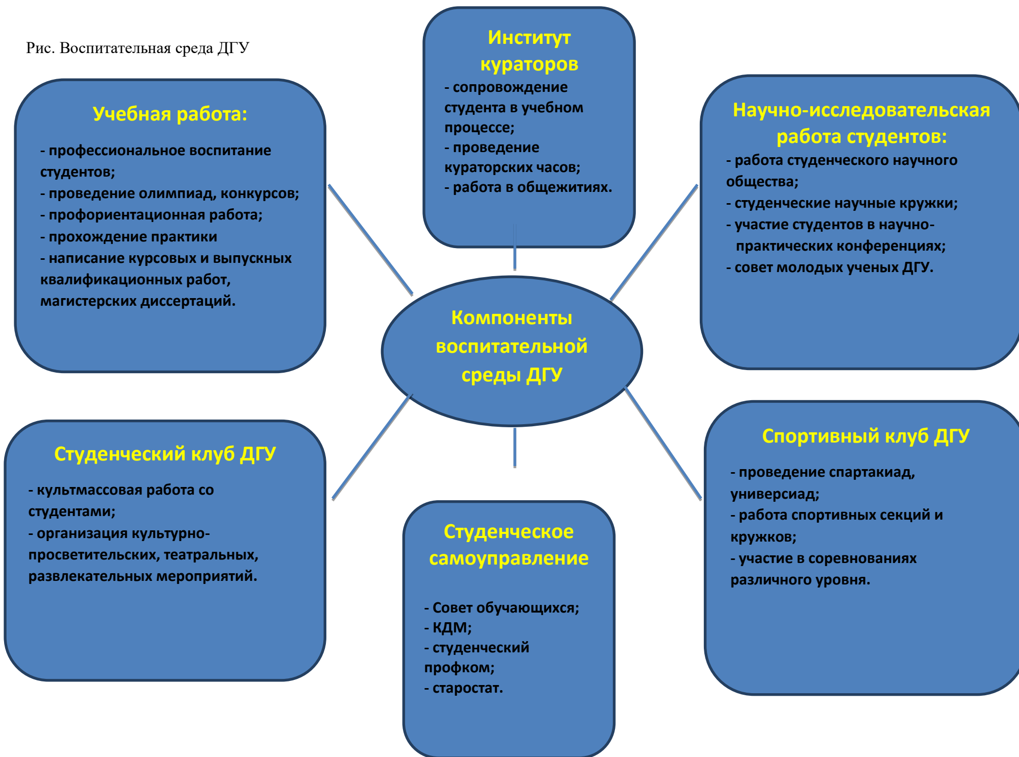
Рис. Воспитательная среда ДГУ