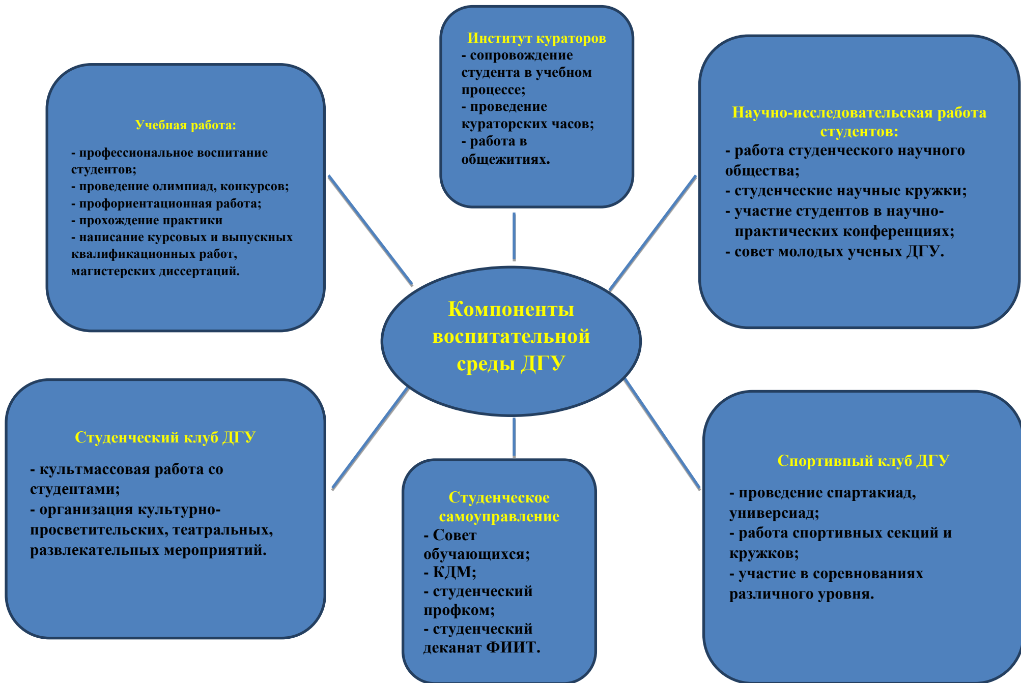
Рис.1 Воспитательная среда ДГУ