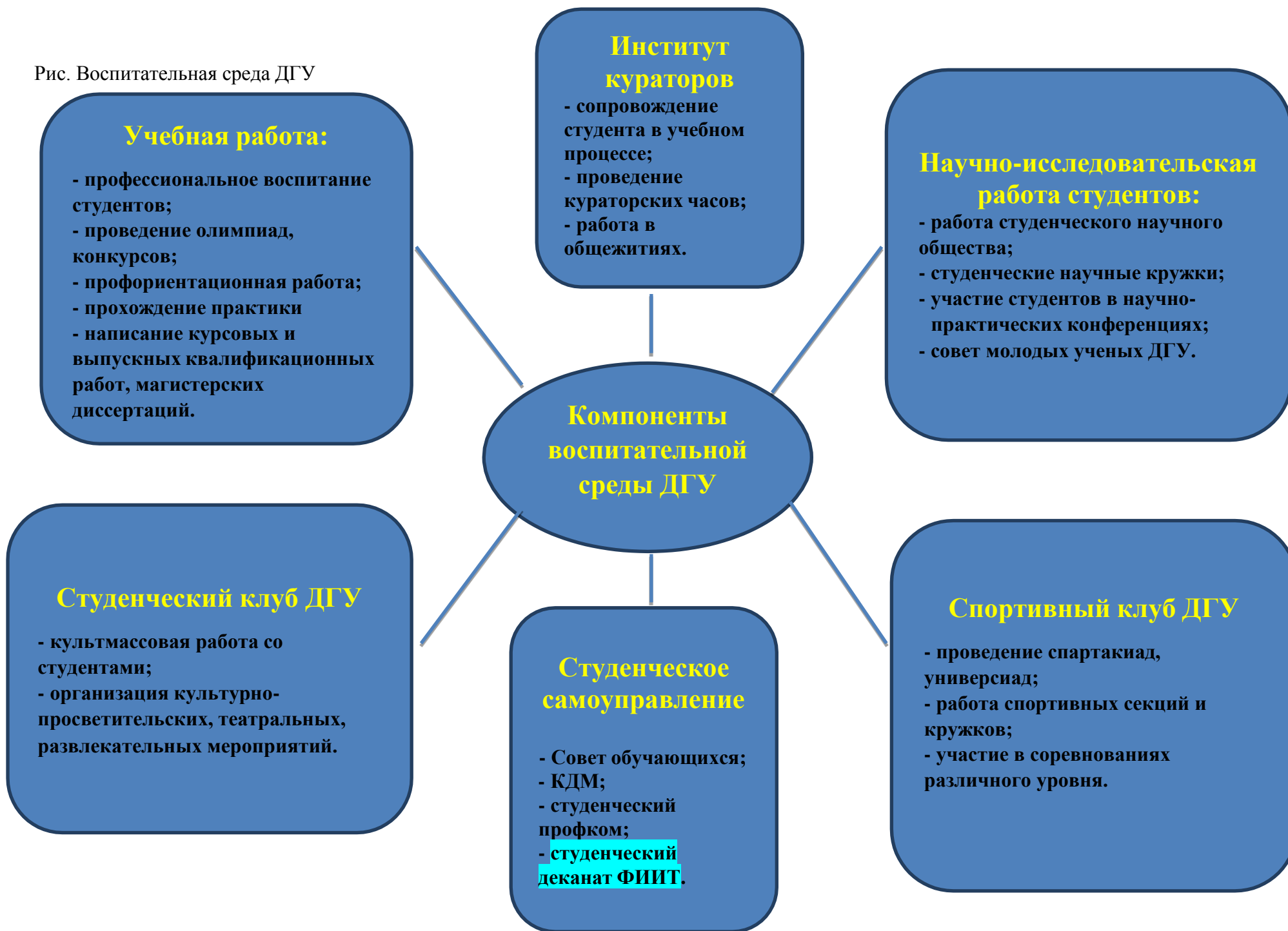
Рис. Воспитательная среда ДГУ