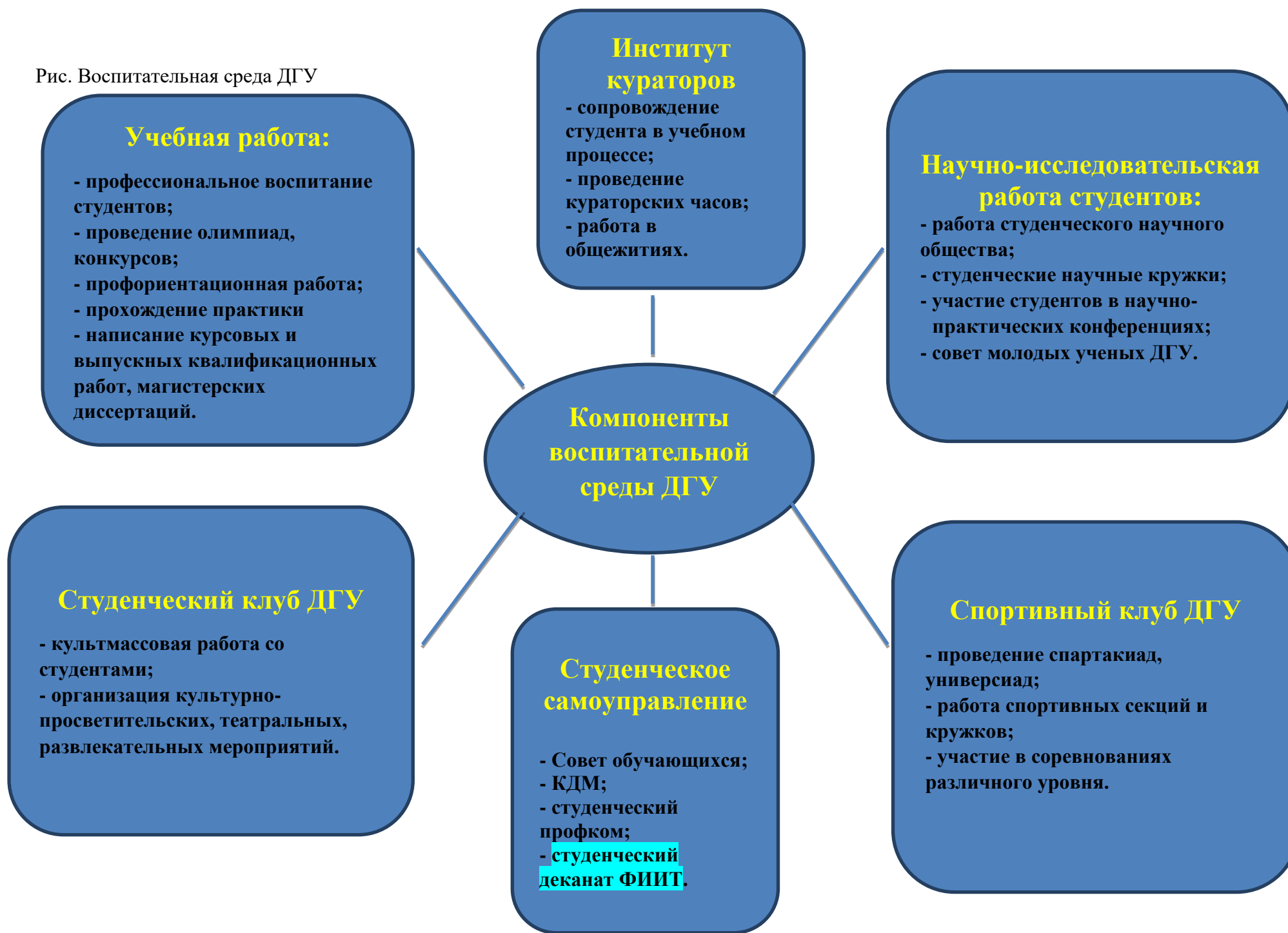
Рис. Воспитательная среда ДГУ