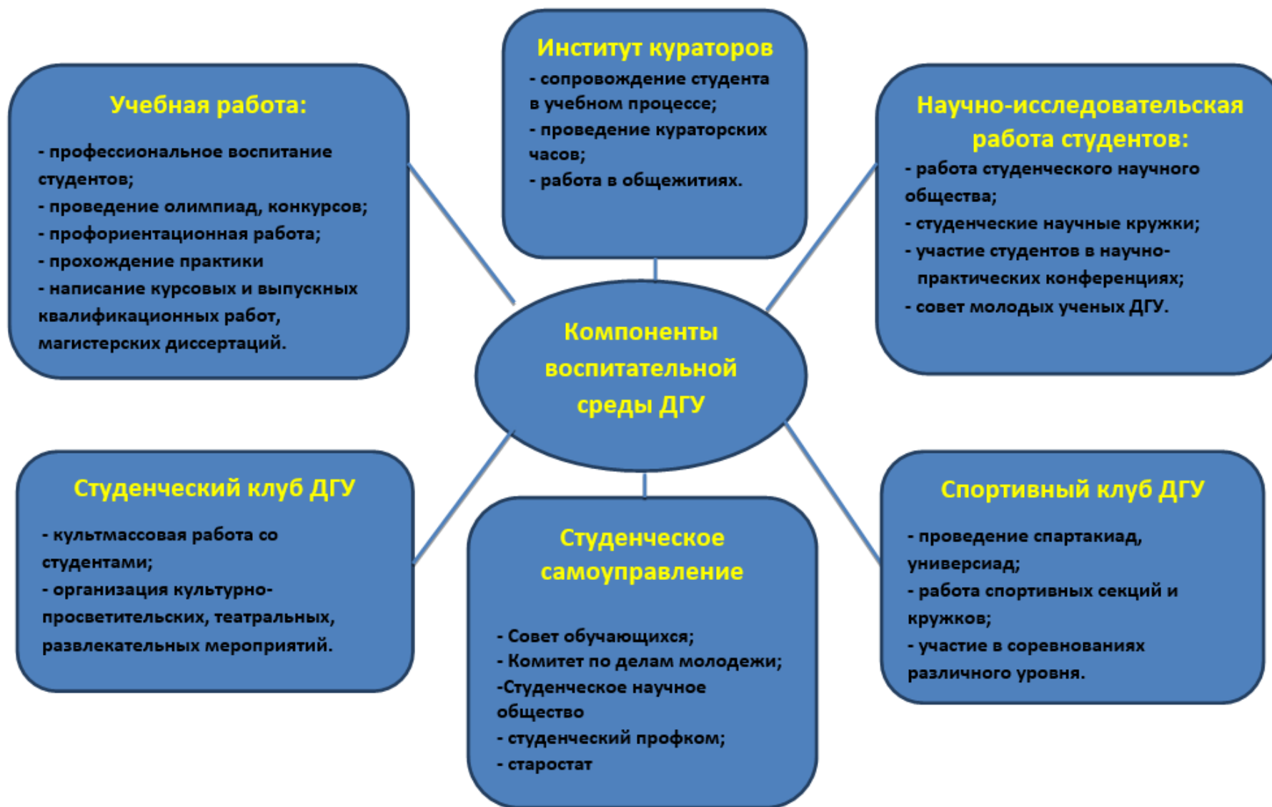
Рисунок 1. Воспитательная среда ДГУ