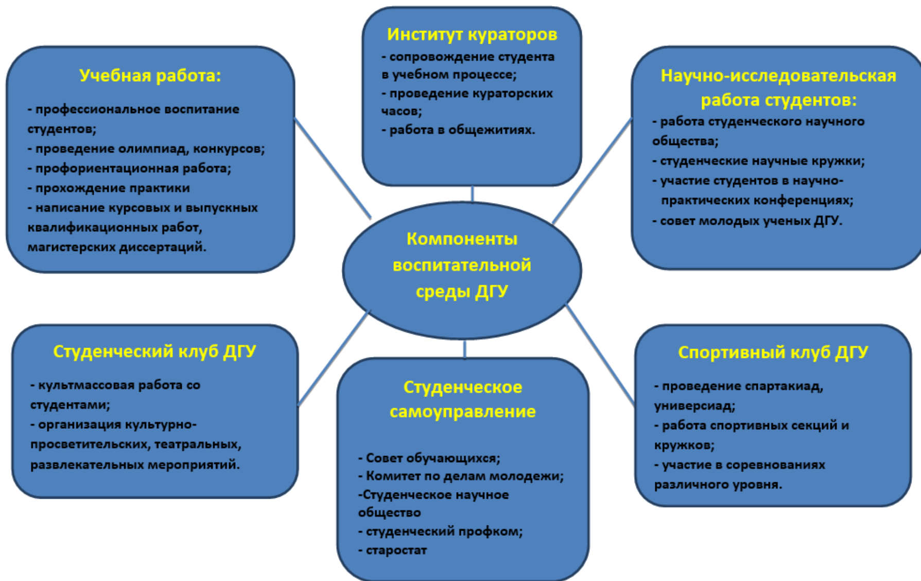
Рис. 1. Воспитательная среда ДГУ