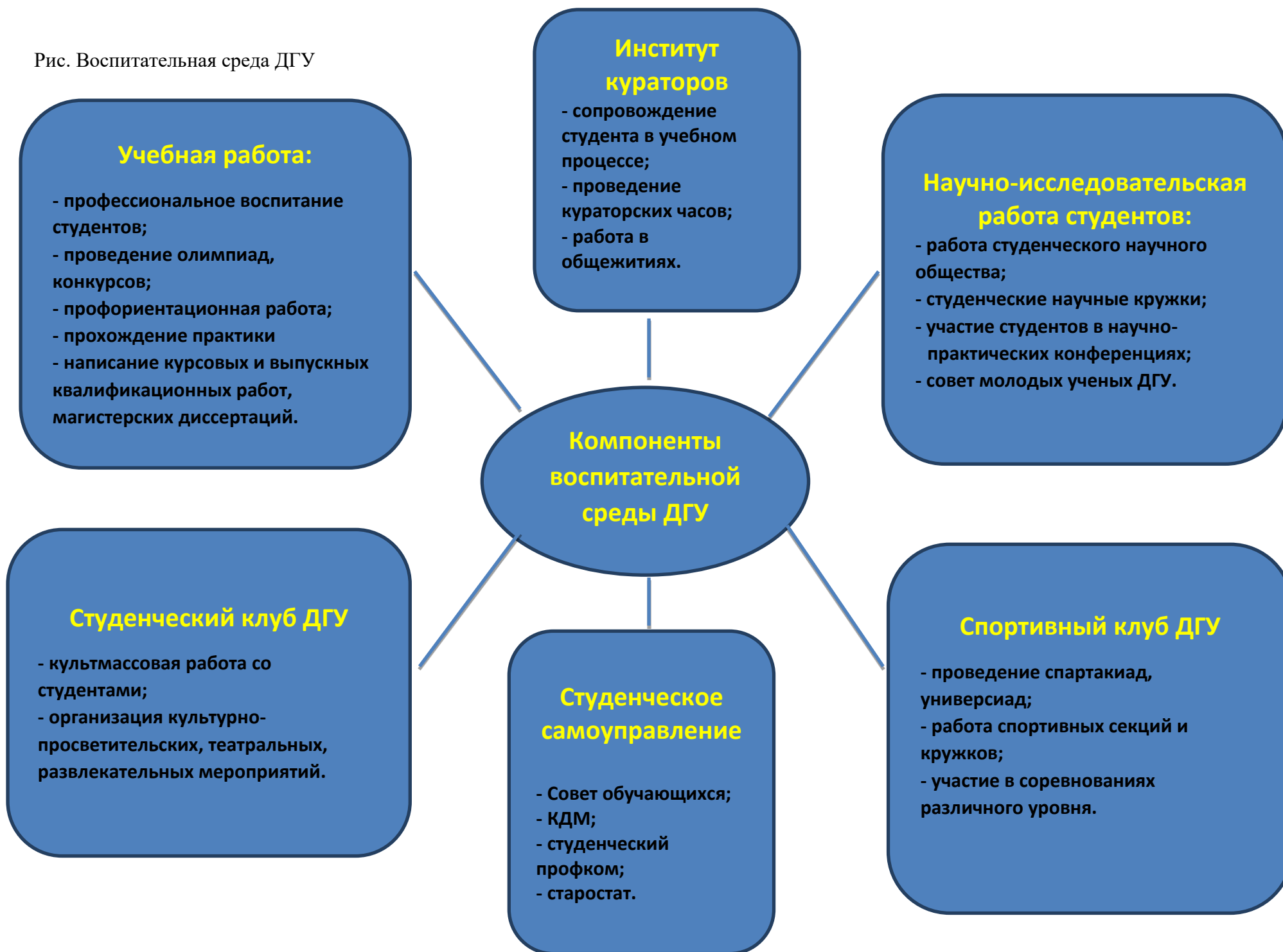
Рис. Воспитательная среда ДГУ