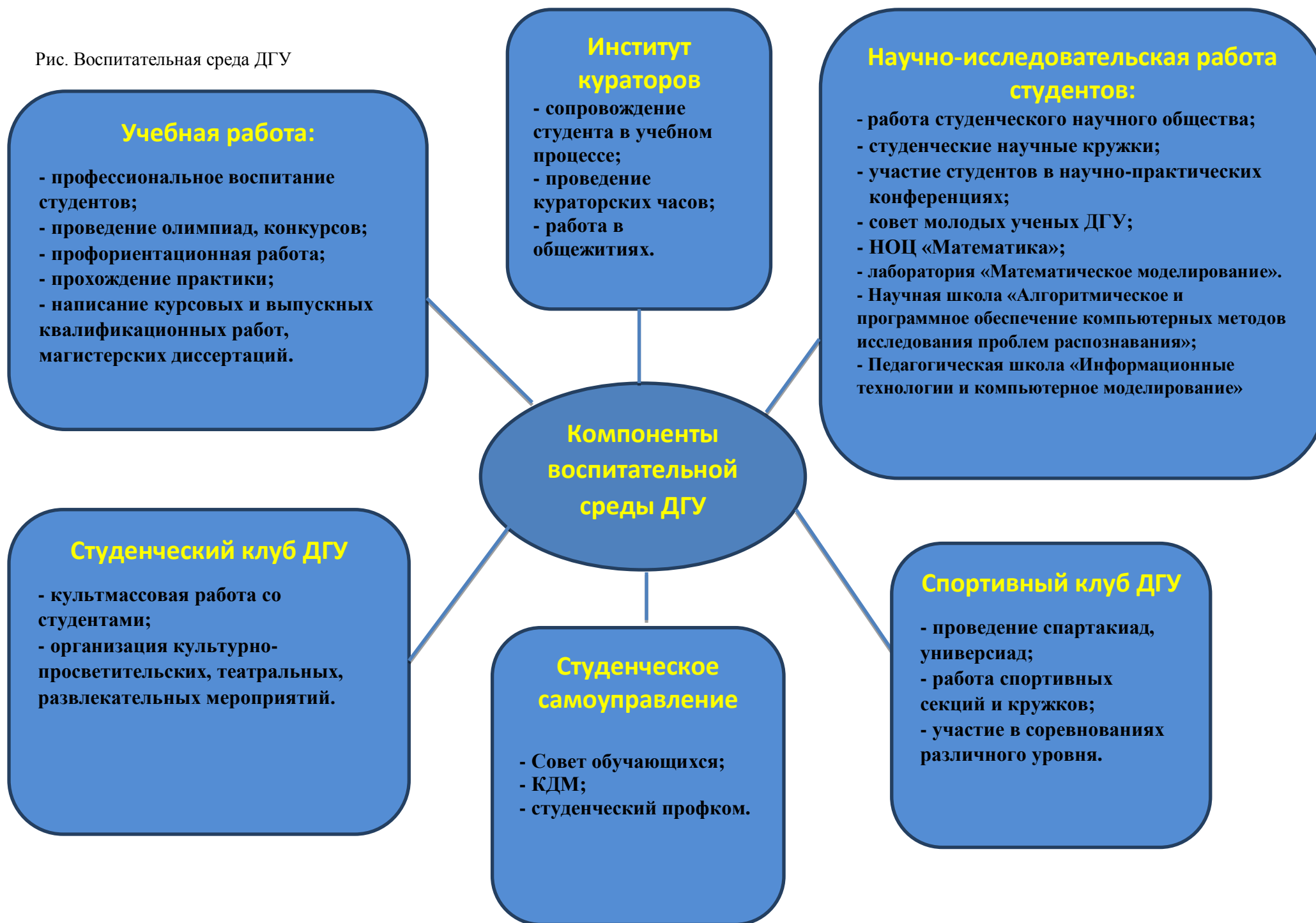
Рис. Воспитательная среда ДГУ