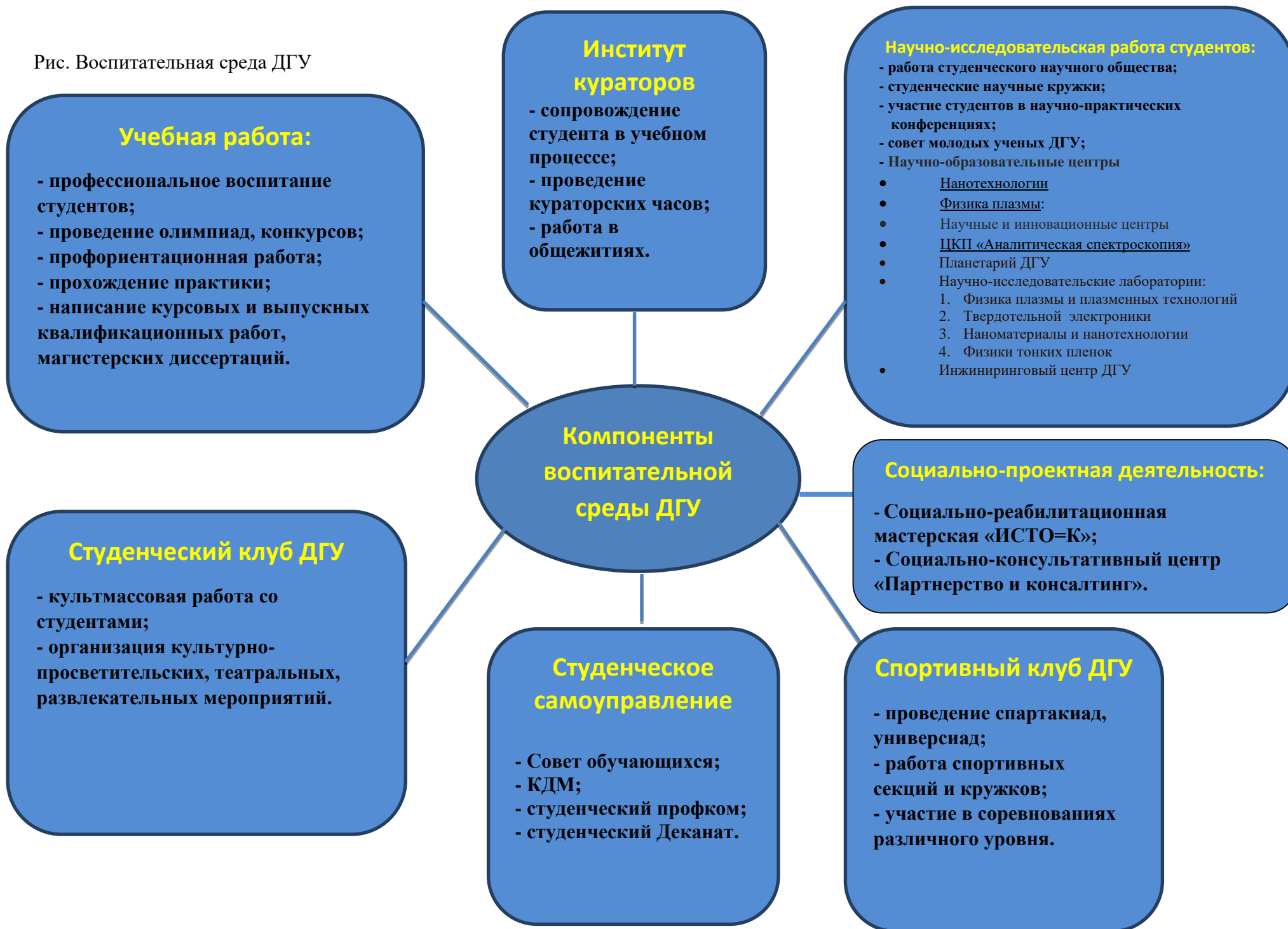
Рис. Воспитательная среда ДГУ