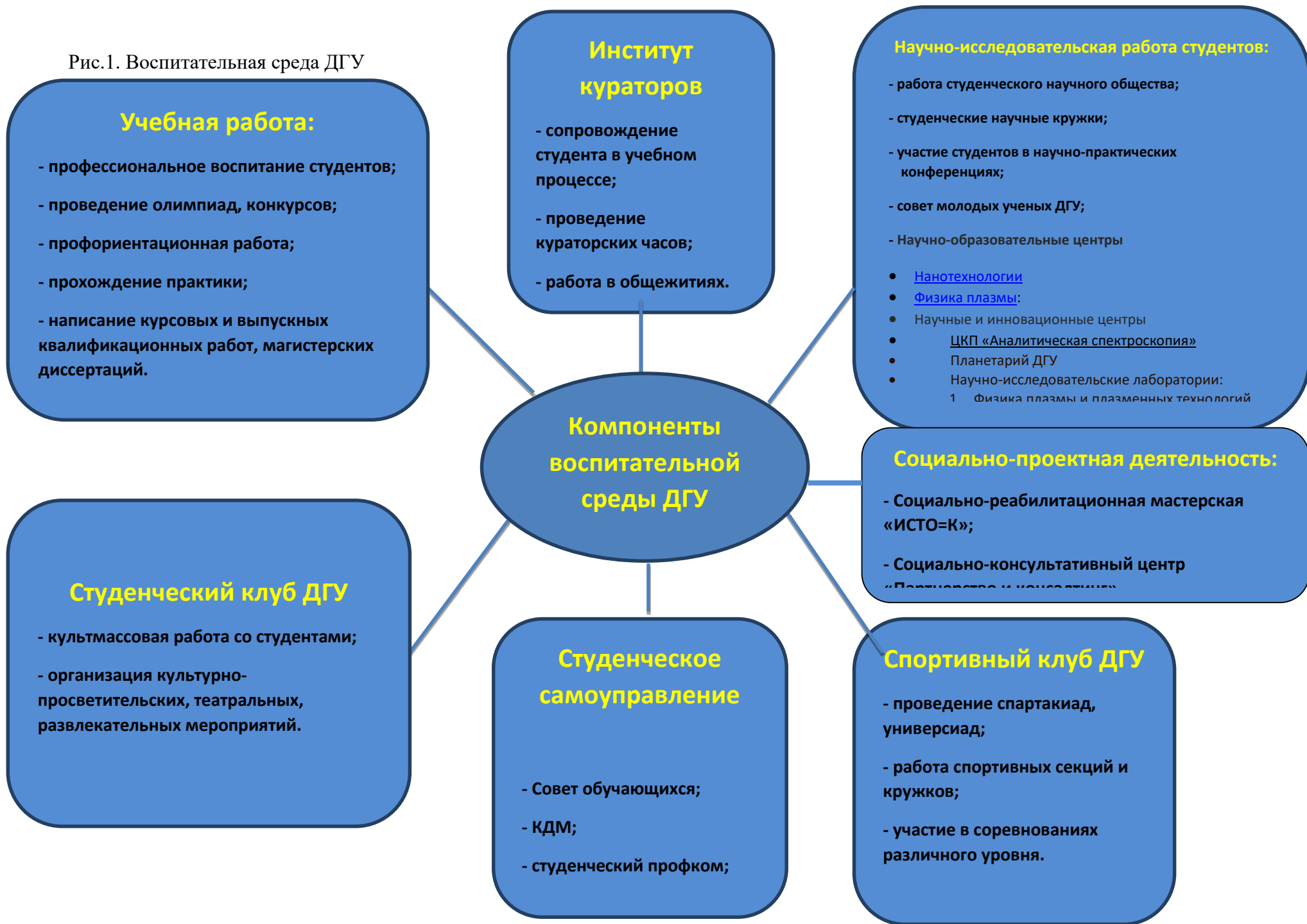
Рис.1. Воспитательная среда ДГУ