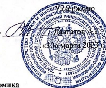
ГРАФИК учебного процесса заочной, контрактной формы обучения ФИИИТ по направлению подготовки: 09.04.03 Прикладная информатика (профиль) Цифровая экономика (квалификация «магистр») на 2023-2024 учебный год

проректор по заочному и дополнительному образованию