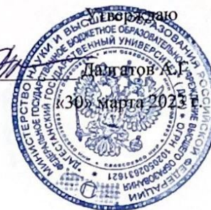
ГРАФИК учебного процесса заочной, контрактной формы обучения ФИИТ по направлению подготовки: 09.03.02 Информационные системы и технологии (квалификация «бакалавр») на 2023-2024 учебный год

проректор по заочному и дополнительному образованию